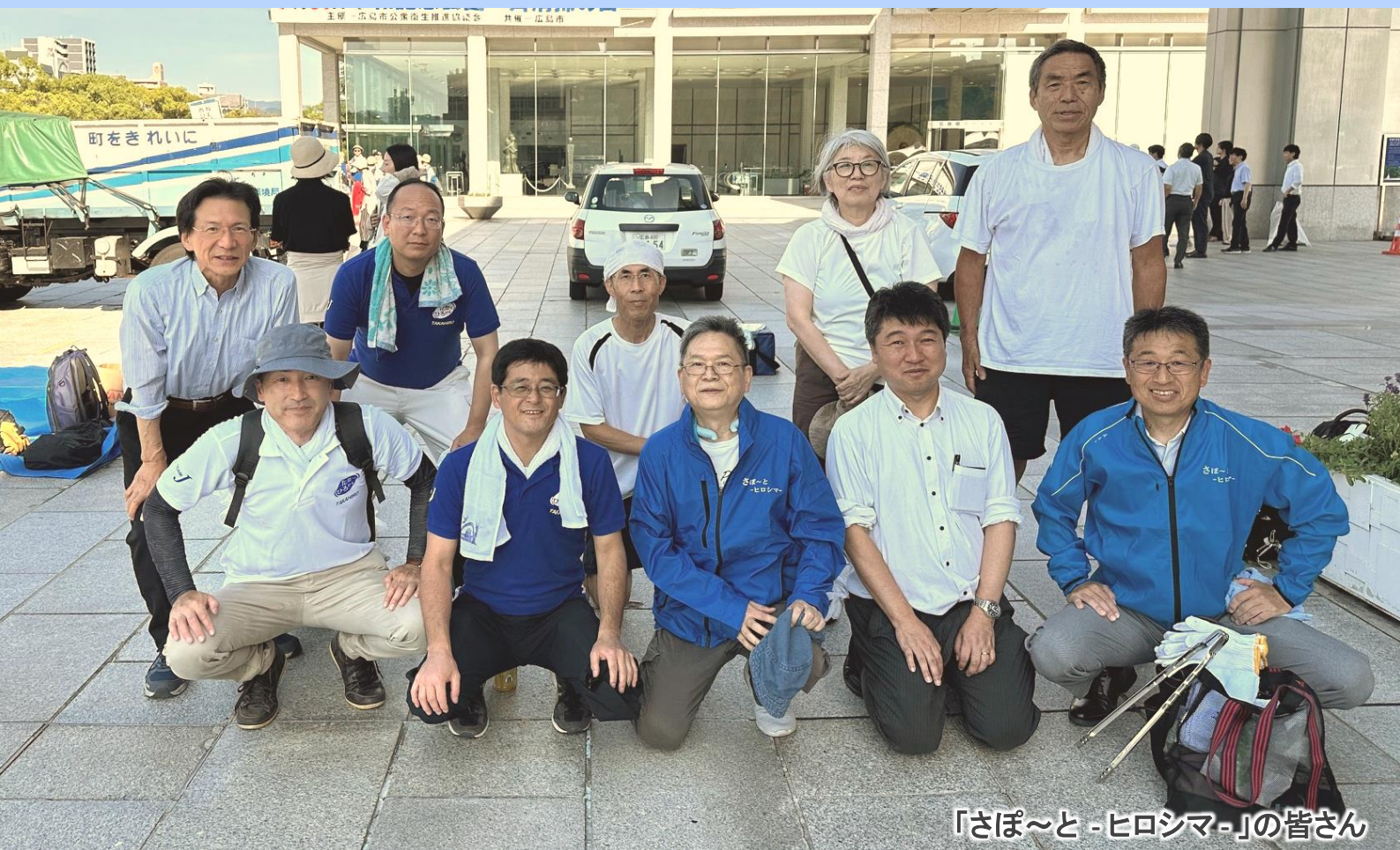
「さぽ〜と・ヒロシマ」の皆さん