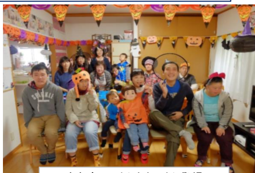
今年もミコリんとタックン登場