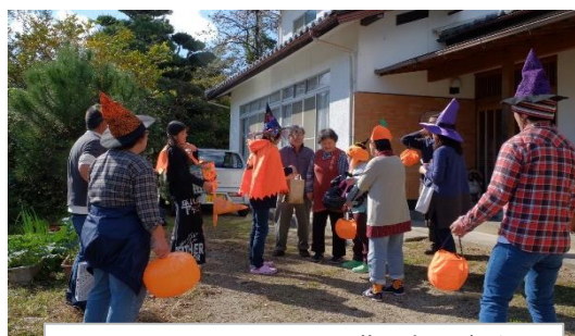
トリック オア トリート！お菓子ありがとう